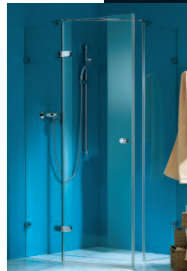
BO 305 TYPE 255

Clear, clean design lines combined with true technological refinement! The versatile BO 305 shower system can be used for many different configurations. Even curved cubicles are possible, with the required curved panels then included in the scope of supply. Overlapping or flush glass-to-glass panel fittings are both available. The flush fittings have a continuous seal; the overlapping fitting version is assembled without an additional seal. Complete prevention of spray water escape is guaranteed in both cases. The BO 305 features a modern design, is quick and easy to install and utterly user-friendly.